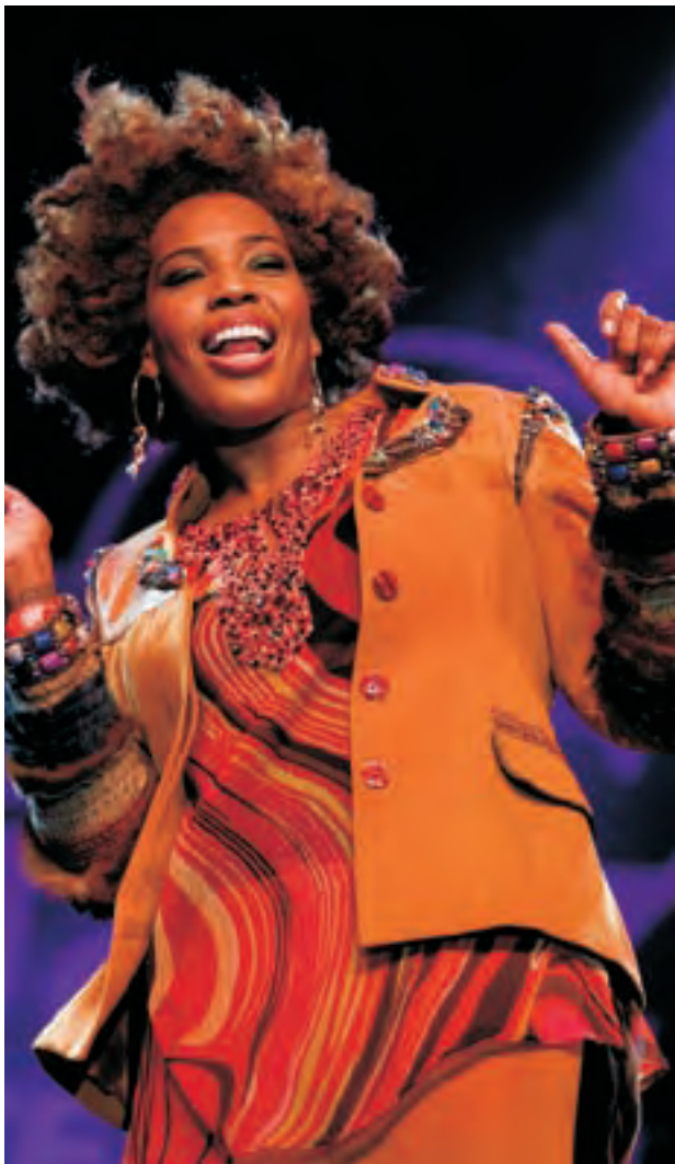
Macy Gray