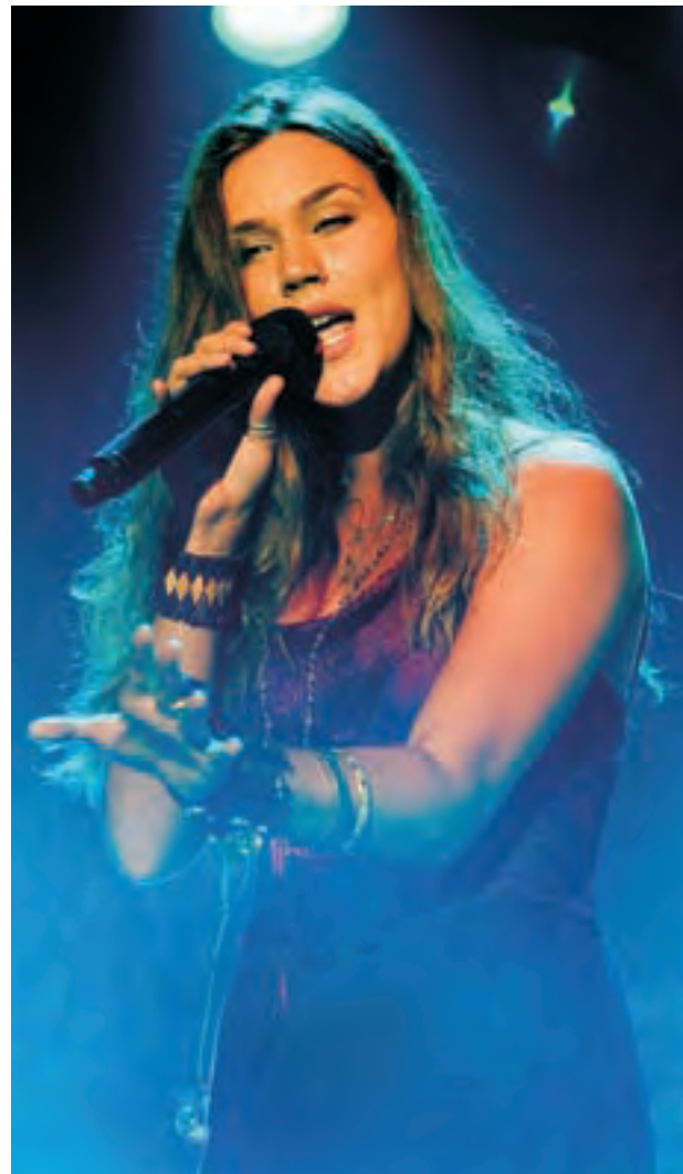
Joss Stone