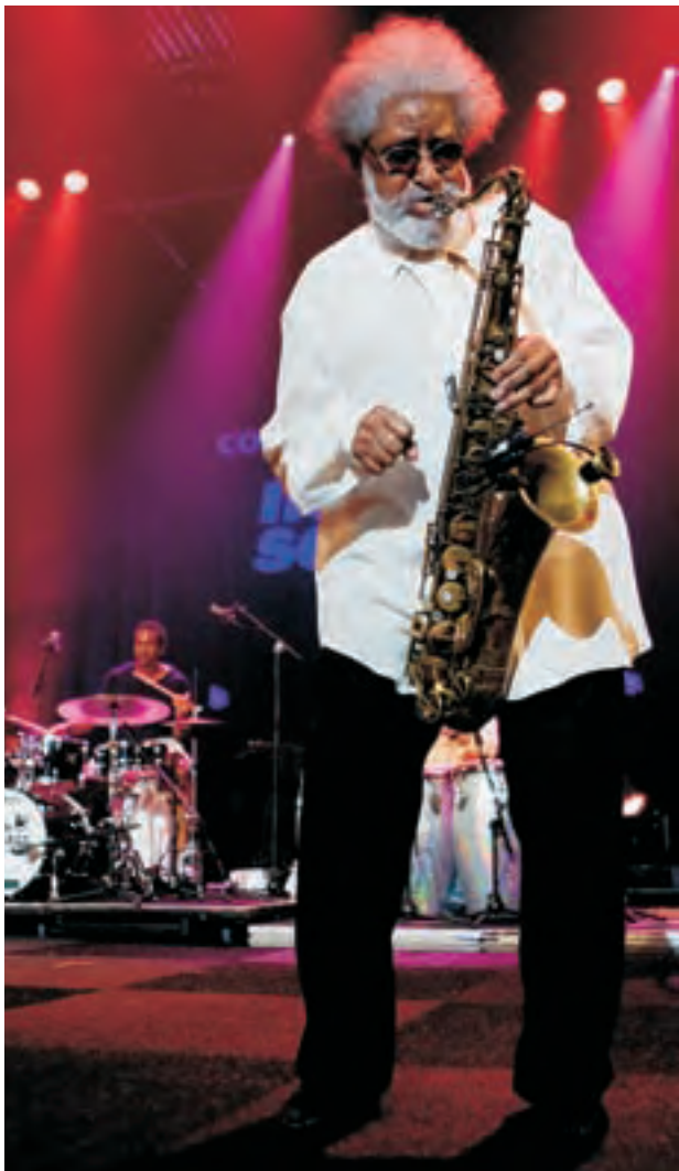
Sonny Rollins