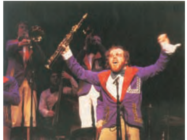
Willem Breuker bij het festival "Klap op de Vuurpijl"

Gedurende al die jaren had hij niet te klagen over waardering. Hij wint de Wessel IJcken prijs (in 1970), de Matthijs Vermeulen prijs,