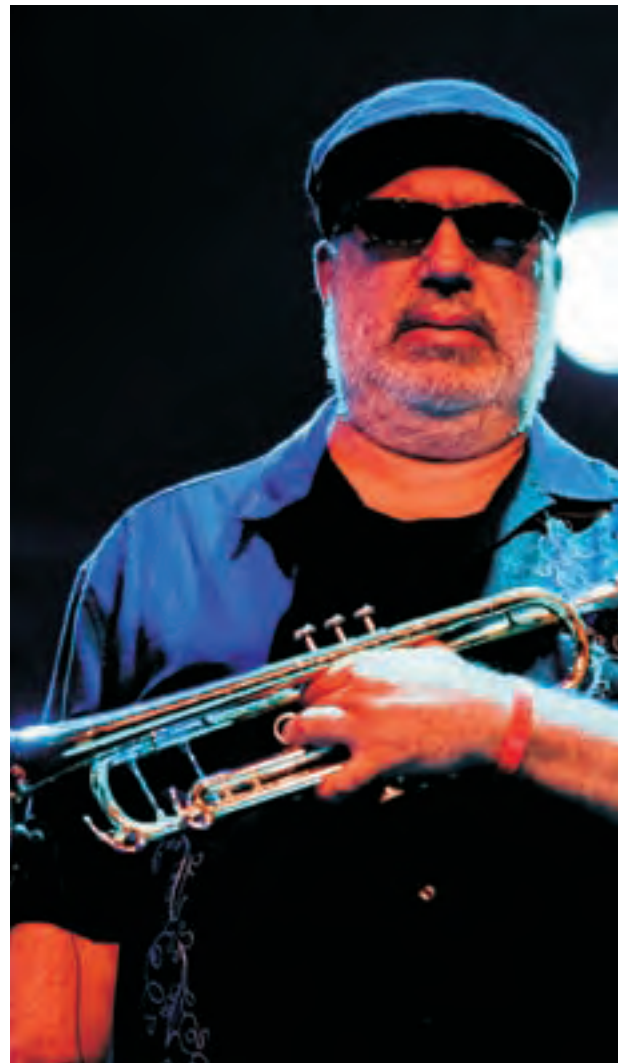
Randy Brecker