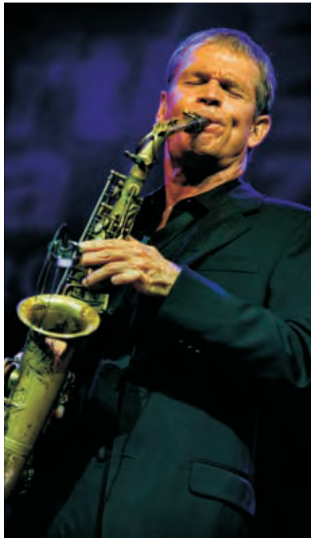
David Sanborn