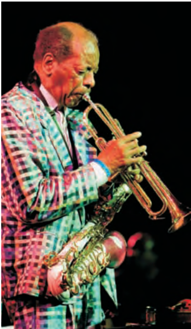
Ornette Coleman