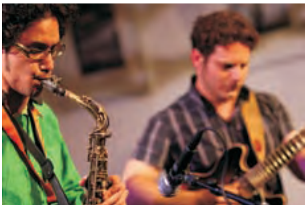
Animated, gespeeld tijdens showcase Jazzdag

ALLES LEZEN OVER MUZIEK MAKEN EN ZINGEN? Neem een abonnement op