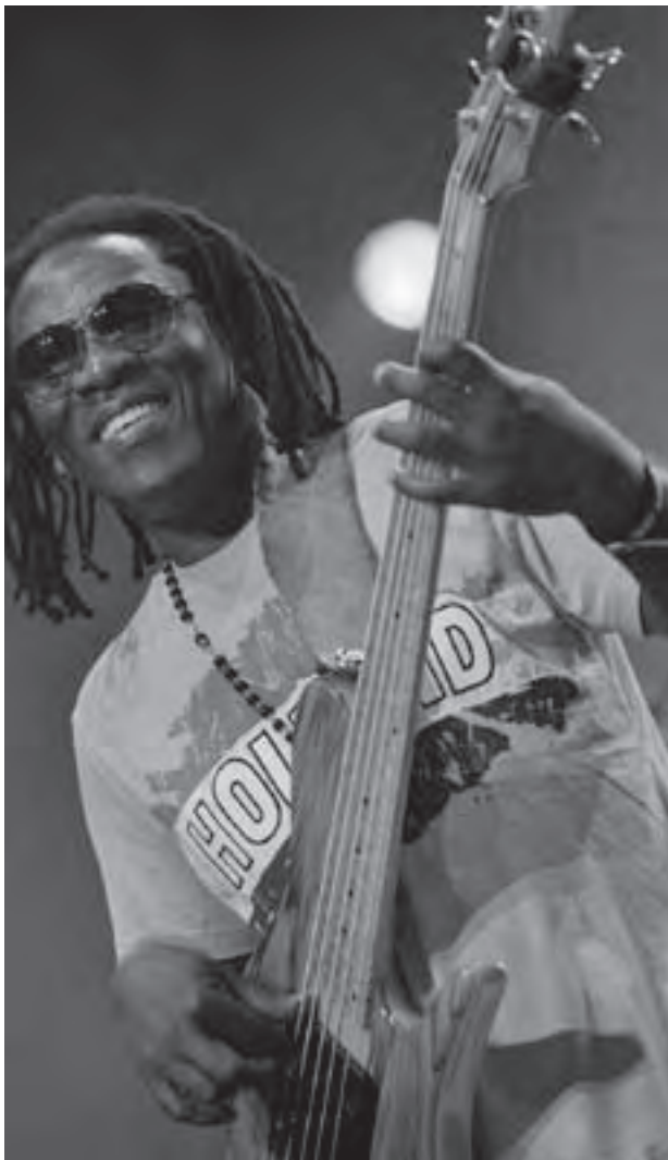
Richard Bona