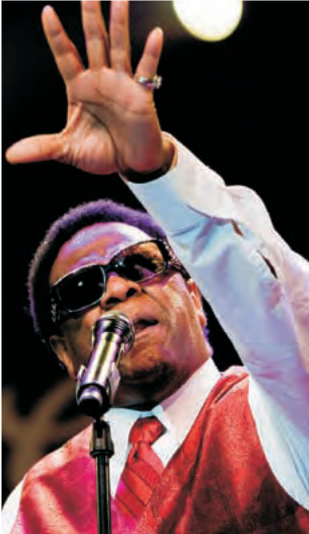
Al Green