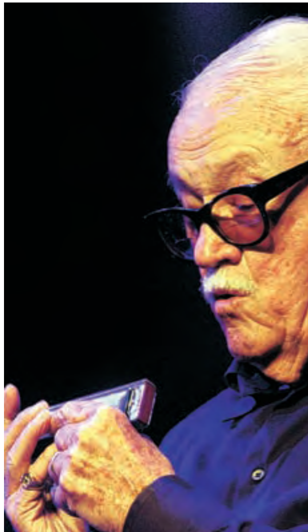
Toots Thielemans

KIJK VOOR MEER INFORMATIE OP WWW.NORTHSEAJAZZ.COM